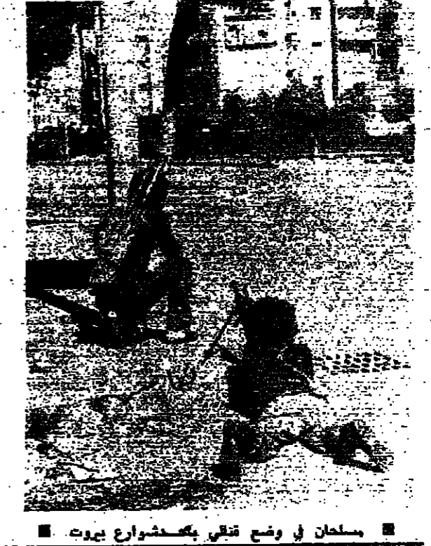
مسلمان في وضع قتالي بمخشوار بيروت

لجنة التنسيق العليا تبحث تطبيق الاتفاقات بين السلطة والمقاومة في القدس ، وفراس في بيروت ، وفي نقادة قوى الامن الداخلي ، ومجلسي التشريعي ، ونقطة التماس . كما انه يرى ان على كل فريق ان يتحمل مسؤولياته كاملة ، ويمد يد الامم المتحدة ، ان تحمل المسؤولية في هذه الظروف واجب وطني تاريخي . اجتماع لجنة التنسيق وقد انصرف الرئيس شمعون بقره امس الى معالجة حالة الامن المتدهورة الوضع من المراي ثم من وزارة الدفاع ، فان اوساطه اكدت انه لا ينبغي الاستقالة ، وهو ياتي قسما لتسوية مع تنظيم حذو . كما انه يرى ان على كل فريق ان يتحمل مسؤولياته كاملة ، ويمد يد الامم المتحدة ، ان تحمل المسؤولية في هذه الظروف واجب وطني تاريخي . اجتماع لجنة التنسيق وقد انصرف الرئيس شمعون بقره امس الى معالجة حالة الامن المتدهورة الوضع من المراي ثم من وزارة